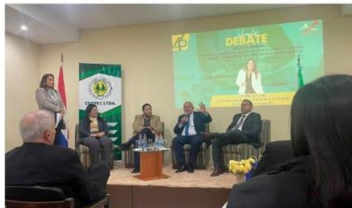
Charla debate día del contador