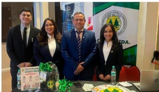
Seminario Nacional de Presupuesto Público JULIO 2025