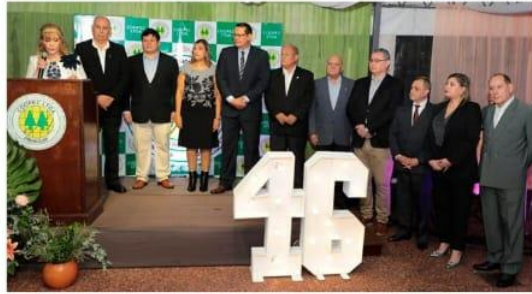
Aniversario N° 46 Coopec Ltda