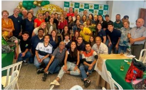
Festejo día del trabajador