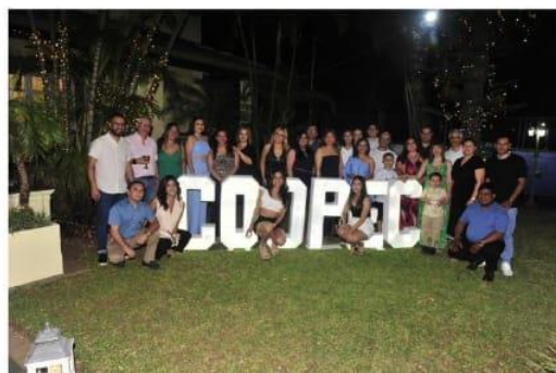
Tradicional cena de fin de año