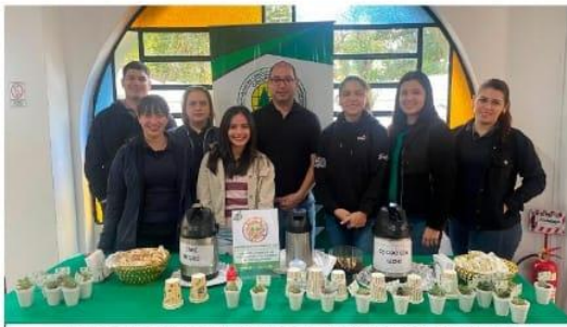
Día Internacional de las Cooperativas y Día Nacional del Cooperativismo