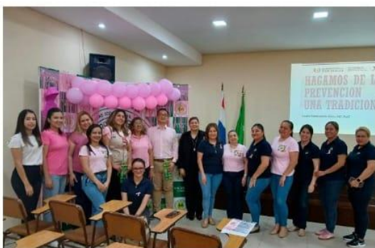
Culminación exitosa de la Charla de Concienciación sobre el Cáncer de Mama