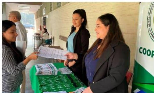
Semana del Economista UNA