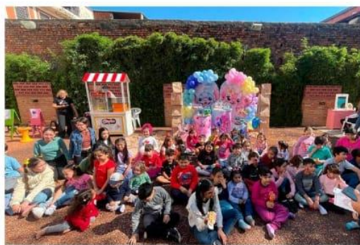
Tradicional festejo día del niño